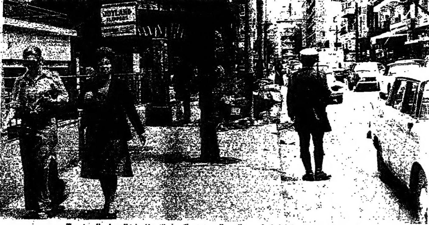
جانب من شارع الحمراء وقد عاد شرطي السير اليه ، ولكن الاسواق ما زالت على الرصيف